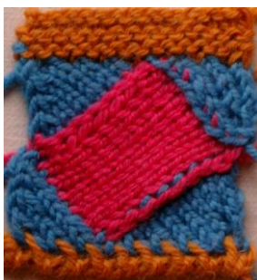
heile og kvart ruter