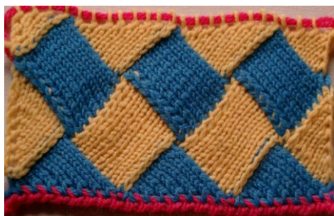
kontstrikking med heile, halve og kvart ruter